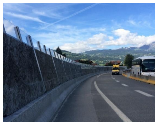
Un écran acoustique à Passy

Pour la lutte contre le bruit , ATMB construit un nouvel écran de protection contre le bruit à Passy sur la Route Blanche dans le sens Chamonix – Genève. Cet écran mesurera 470 m de long et permettra d'améliorer la protection acoustique des riverains. Les travaux se dérouleront du 16 avril au 6 juillet puis du 3 au 28 septembre, afin de laisser les voies libres pour le trafic touristique dense de juillet et août. Ce mur représente un investissement de 690 000 euros pour ATMB. Dans le cadre de sa politique environnementale, ATMB protège les habitations en appliquant un seuil de protection plus exigeant que la réglementation, soit 2 décibels en-dessous des normes européennes.