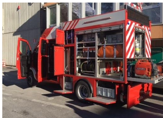
Le premier VPI du Tunnel du Mont Blanc

Un nouveau véhicule de première intervention (VPI) arrive au Tunnel du Mont Blanc , après une phase de tests en conditions réelles. Deux autres spécimens seront donc livrés au mois de septembre 2018. Ils sont notamment équipés de radar détecteur d'obstacles, de caméra thermique et d'équipements de désincarcération. Grâce à ces VPI, les équipes de sécurité procèdent aux premiers secours et protègent les interventions, en cas de véhicule en panne par exemple. Ils s'occupent de la première intervention sur les incendies, en soutien des pompiers du tunnel. Chaque VPI représente un investissement de 180 000 euros (1) .