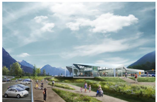
La future aire de service de Bonneville

La première pierre de la nouvelle aire de service de Bonneville sera posée en septembre 2018. Pour le moment, une passerelle piétonne permet de relier les deux aires actuelles. Elle sera supprimée pour laisser place au pont routier qui permettra d'accéder à la nouvelle aire bidirectionnelle, située dans le sens Genève-Chamonix, quel que soit son sens de circulation. Cette future aire sera plus grande et mieux adaptée aux besoins des clients de l'Autoroute Blanche. Le nombre de places de parking sera augmenté pour accueillir les conducteurs en provenance de Mâcon/Genève et de Chamonix : 168 places pour les