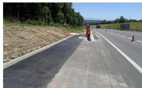
Un refuge de sécurité avec une borne d'appel d'urgence

Dans le cadre du programme de création de refuges pour la sécurité des conducteurs , six refuges seront créés en 2018. Ils mettront fin à un programme de huit années nécessaires à l'aménagement des 110 refuges de l'Autoroute Blanche. La chaussée sera élargie pour permettre d'optimiser les conditions de sécurité des conducteurs. Les bornes oranges, ou bornes d'appel d'urgence, sont quant à elles adaptées aux personnes à mobilité réduite et aux malentendants. Ces travaux s'élèvent à un montant total de 10,6 millions d'euros, dont 740 000 en 2018.