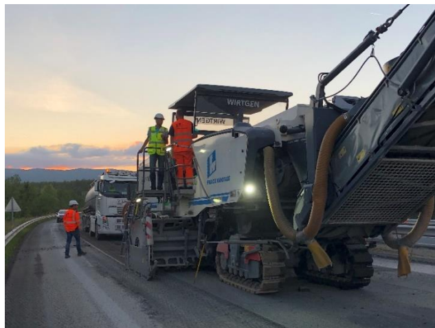
Les chaussées en cours de rénovation

L'A411 et la douane de Vallard/Thonex seront fermées de 20h30 à 5h30, avec déviation par la douane de Fossard (cf plans ci-dessous) :