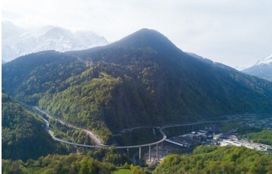
Descente des Egratz

Depuis le lundi 18 mai et jusqu'au vendredi 26 juin , les équipes d'ATMB réalisent des travaux d'entretien sur la Route Blanche au niveau de la descente des Egratz entre le tunnel du Châtelard et Passy : purge des caniveaux, entretien des filets de protection contre le risque rocheux, des glissières de sécurité. Ces travaux nécessitent la fermeture des deux voies de circulation en direction de Genève. Les conducteurs circulant en direction de Genève, sont basculés sur le viaduc des Egratz, mis à double sens .