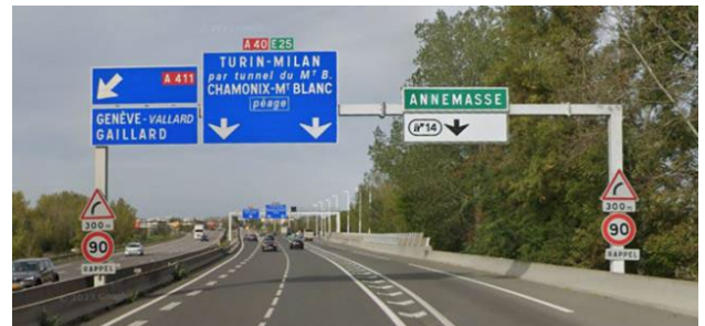
Sortie n°14 Annemasse A40

En journée, des perturbations de circulation restent possibles aux heures de congestion.